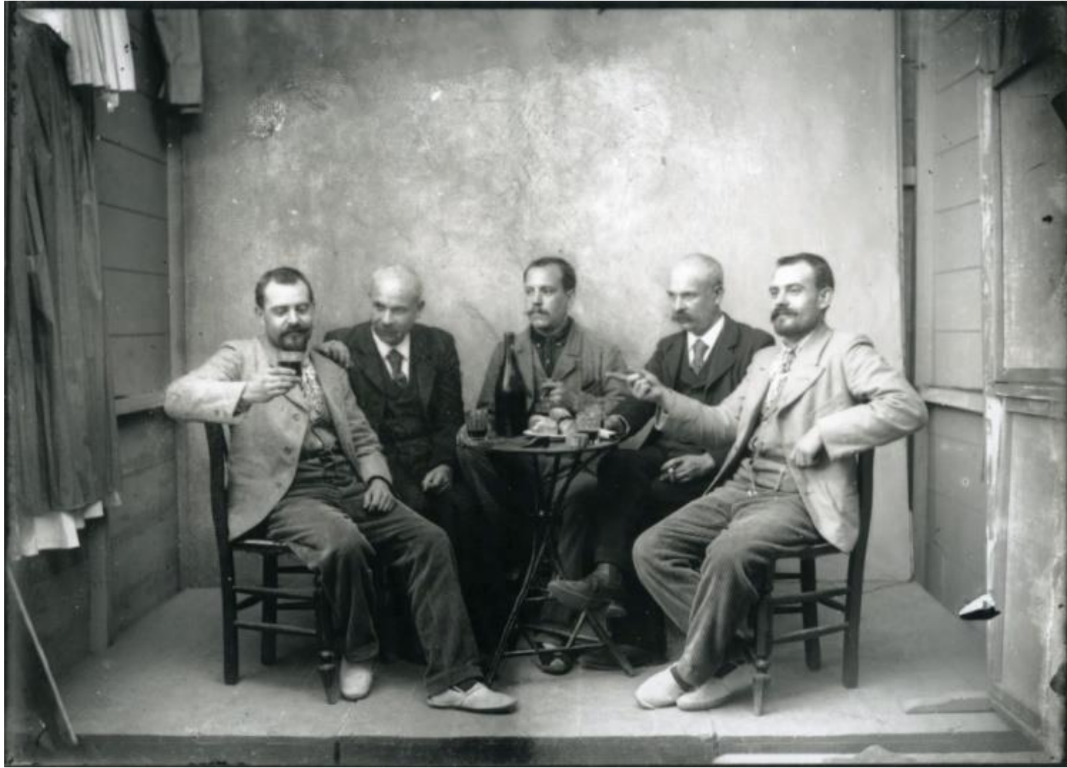
Jaume Ferrer. Muntatge fotogràfic, amb dos personatges repetits en diferents posicions , [s. d.]. Arxiu Municipal de Palafrugell. Fons Fotografia Jaume Ferrer Massanet.

También podéis acceder a la fototertulia a través del enlace (la sesión se grabará en vídeo): https://meet.jit.si/FTT_2021