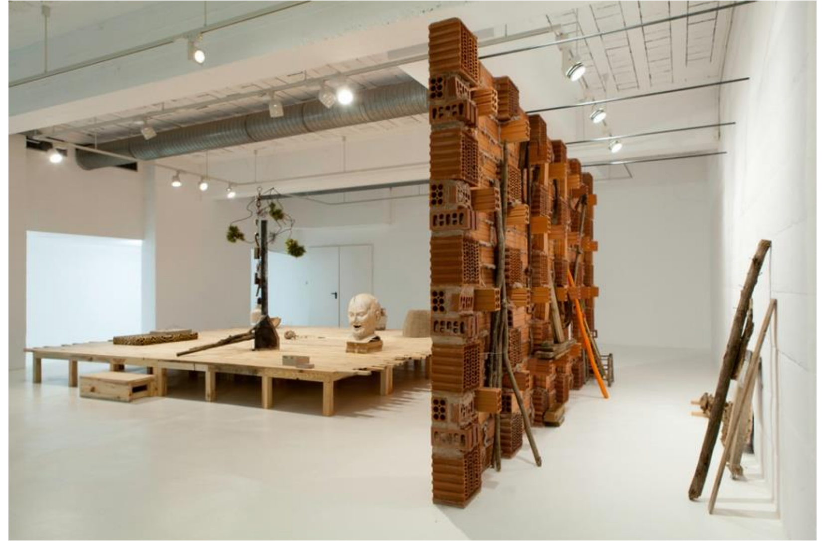
Pere Pratdesaba. Monument. Lladres de filferro , Jordi Mitjà, 2012. Instalación. Espai 13, Fundació Joan Miró. Barcelona. ( https://jordimitja.wordpress.com/2012/10/10/jordi-mitja/ )

La relación entre el archivo y la práctica artística ha entrado en una nueva fase en los últimos tiempos. La posición de centralidad que ocupan los documentos de archivo en las prácticas artísticas, y cómo los artistas han vuelto la mirada hacia aquéllos, es el tema en torno al cual gira esta presentación.