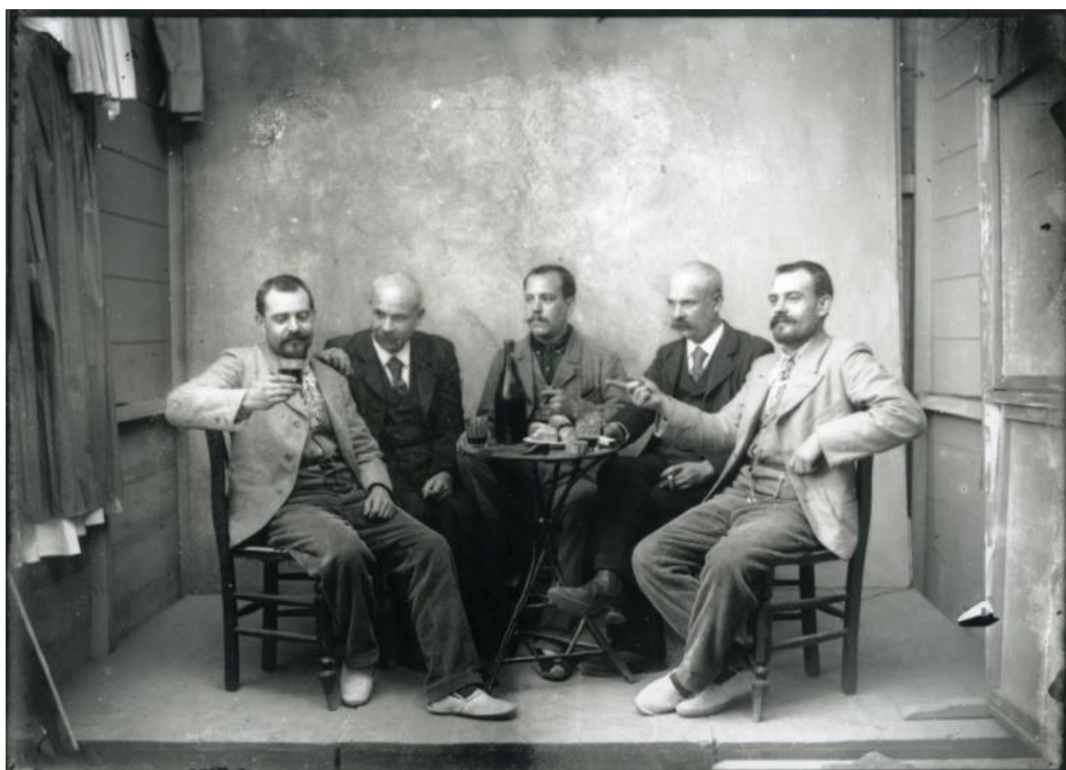
Jaume Ferrer. Muntatge fotogràfic, amb dos personatges repetits en diferents posicions , [s. d.]. Arxiu Municipal de Palafrugell. Fons Fotografia Jaume Ferrer Massanet.

També podeu accedir a la fototertúlia en aquest enllaç (la sessió es gravarà en vídeo): https://meet.jit.si/FTT_2021