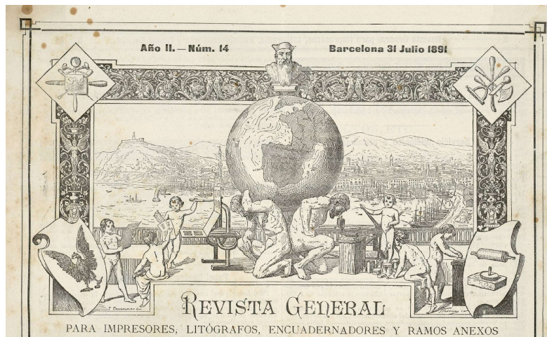
Capçalera de la Revista general para impresores, litógrafos, encuadernadores y ramos anexos (1890-1892).

A banda de la progressiva mecanització de la tècnica d'estampació tipogràfica i de la millora i el desenvolupament de la litografia i la cromolitografia, el món de les arts gràfiques es va veure fortament sacsejat per la irrupció dels procediments fotomecànics, derivats de la fotografia.