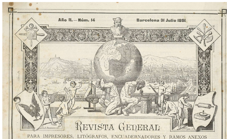
Cabecera de la Revista general para impresores, litógrafos, encuadernadores y ramos anexos (1890-1892).

Además de la progresiva mecanización de la técnica de estampación tipográfica y de la mejora y el desarrollo de la litografía y la cromolitografía, el mundo de las artes gráficas se vio fuertemente sacudido por la irrupción de los procedimientos fotomecánicos, derivados de la fotografía.