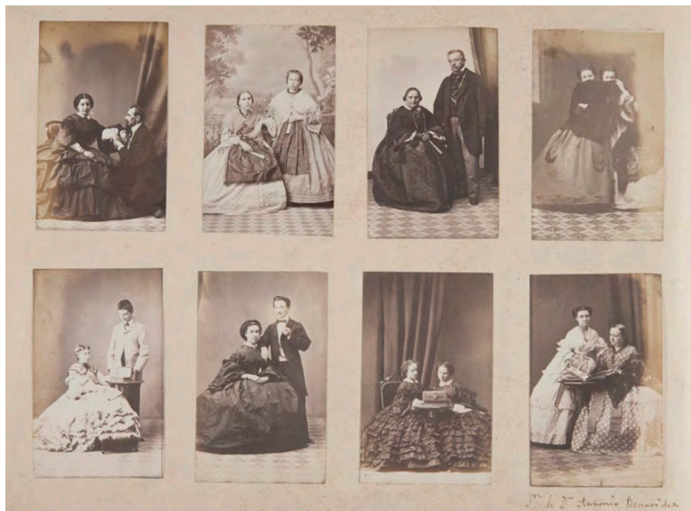
Vista d'un dels àlbums fotogràfics de la Col·lecció Castellano, ca. 1860, Biblioteca Nacional de España.