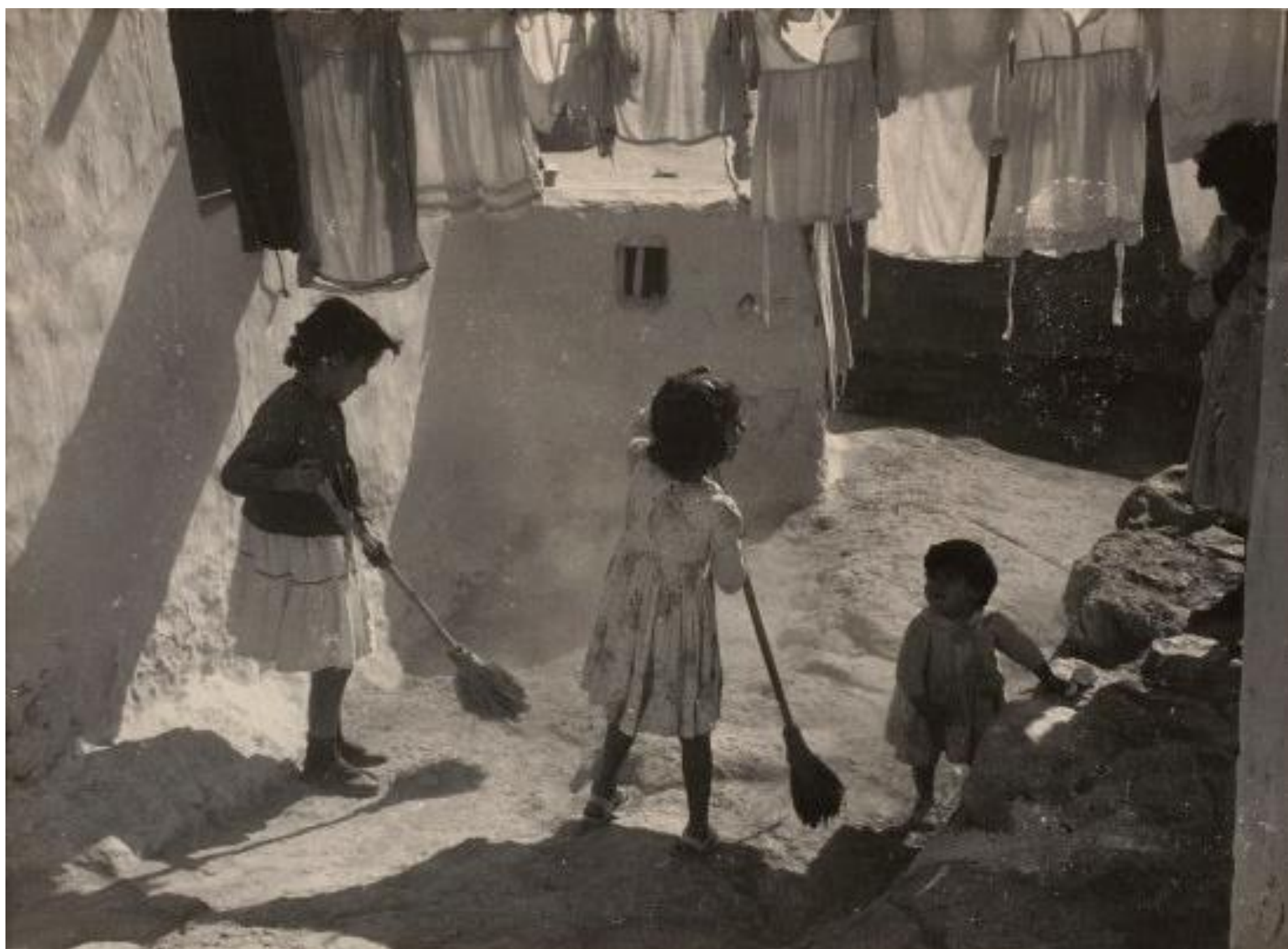
La Chanca, Almería. 1956.

Sala Fundación MAPFRE Casa Garriga Nogués. C/ Diputació, 250. Barcelona.