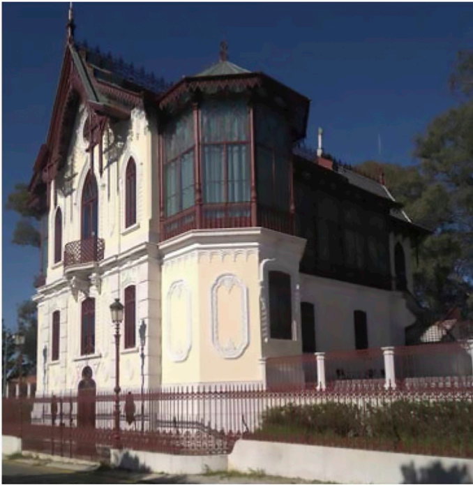
Estúdi Relvas, Golegã (Portugal), 2019, foto Escalada.