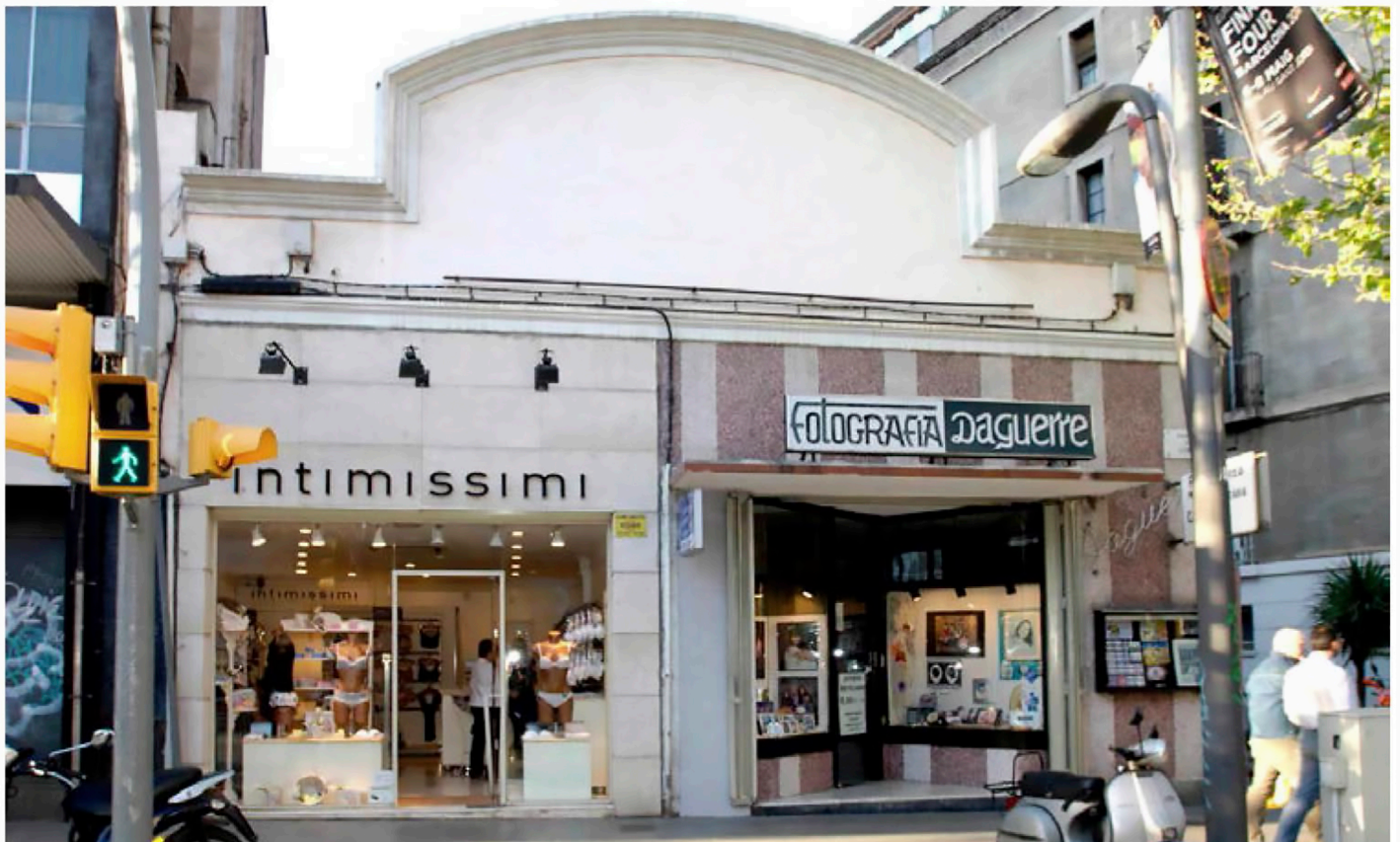
Fotografia Daguerre, Barcelona, 2014, foto Ricard Marco.

Com Daguerre , dos estudis de Bombai no han deixat mai de funcionar, adaptant-se als nous temps; però la major part dels que continuen actius han passat per un procés de recuperació que els hi ha donat nova vida al mateix temps que ha enriquit l'oferta cultural i d'oci de les ciutats: transformats en petits museus amb activitats fotogràfiques (analògiques i digitals),