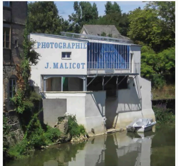
Atelier Malicot, Sablé-sur Sarthe (França), 2013, foto Escalada.