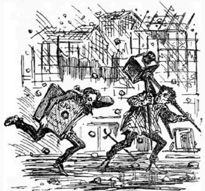
El granizo de 1866 cayó como pedrada en galería de fotografía.