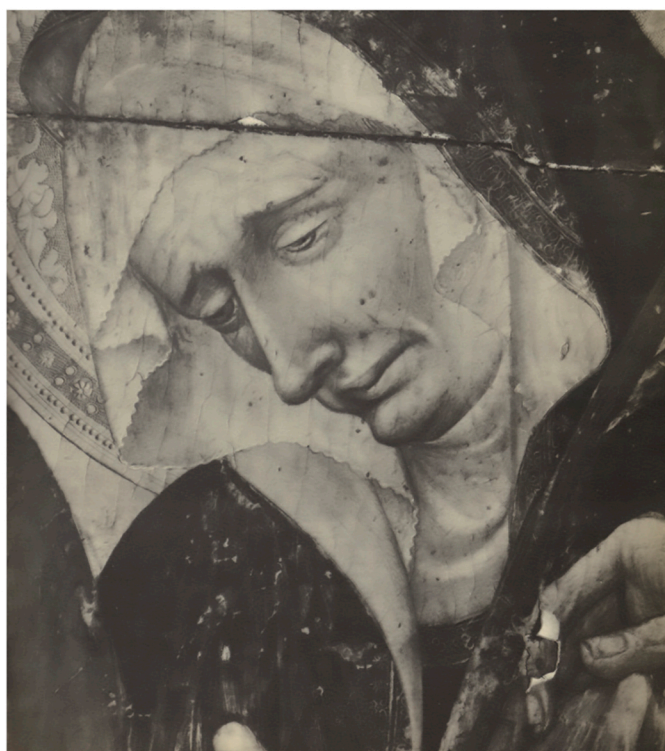
Detall d'una pintura de Lluís Borrassà (1410). Museu de Manresa. Imatge continguda a Le sauvetage du patrimoine historique et artistique de la Catalogne. [?]:Comissariat de Propaganda de la Generalitat de Catalunya, 1937.