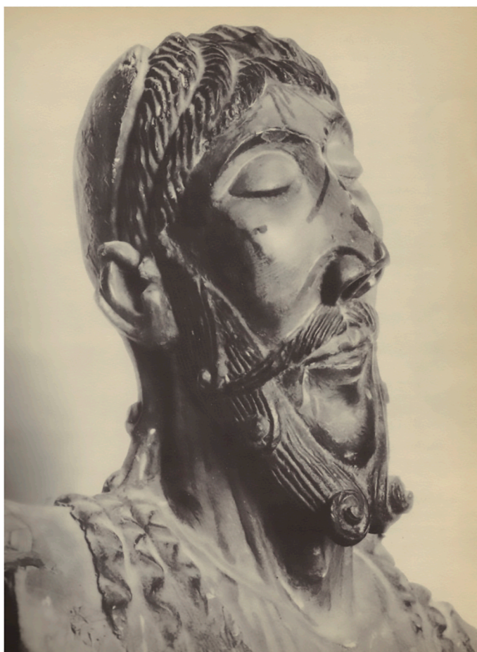
Cap en fusta policromada de Mig Aran (segle XII). Museu de Lleida. Imatge continguda a Le sauvetage du patrimoine historique et artistique de la Catalogne . [?]: Comissariat de Propaganda de la Generalitat de Catalunya, 1937

Va ser amb la mobilització de tots aquests recursos que va ser capaç de crear un producte fotogràfic més interessant i molt més adequat a les necessitats dels investigadors del món de l'art del moment, fet que va fer possible que l'A.D.A.C. entrés en competència directa amb l'Arxiu Mas; una competència que finalitza l'any 1941 amb la fun-